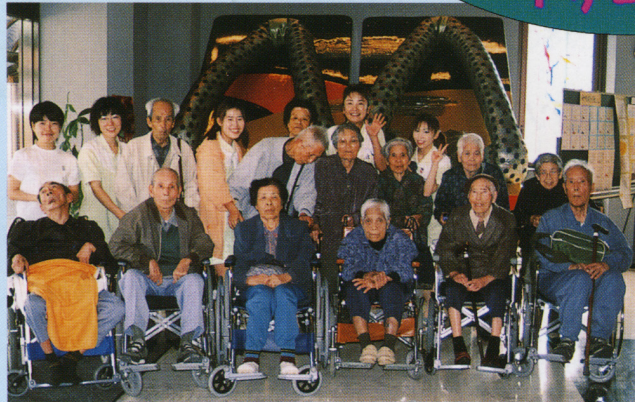
秋のお出かけ(はきもの博物館にて)