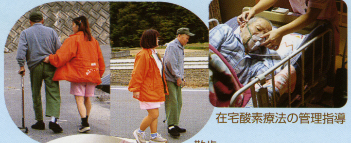
在宅酸素療法の管理指導

当ステーションは、本人はもとより、長期に介護されているご家族のストレス解消・精神的支援のため、いつでもどこでも何でもご相談していただける環境づくりを心掛けています。それでは、どうぞお気軽にご用命ください。