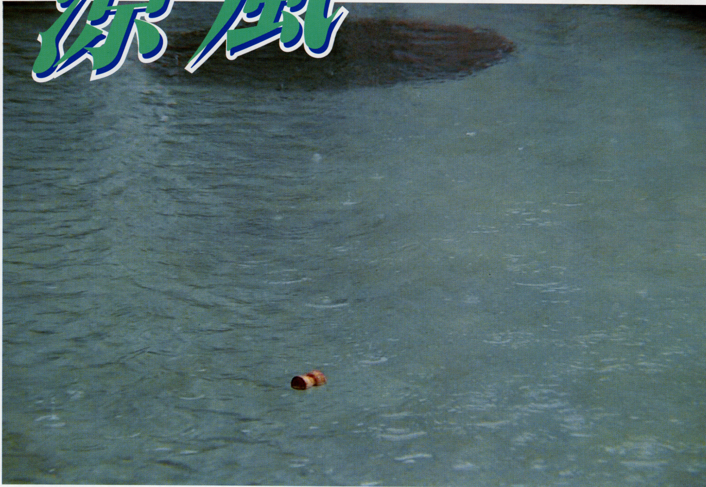
水庭に浮かぶシャンペンコルク (10. 21. 2001)