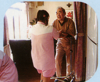
歩行器による歩行訓練