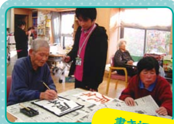
書き初め 上手ですね。