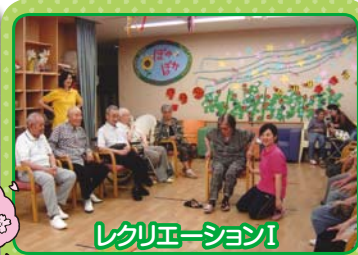
レクリエーションI