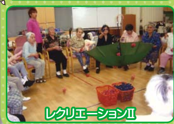
レクリエーションII