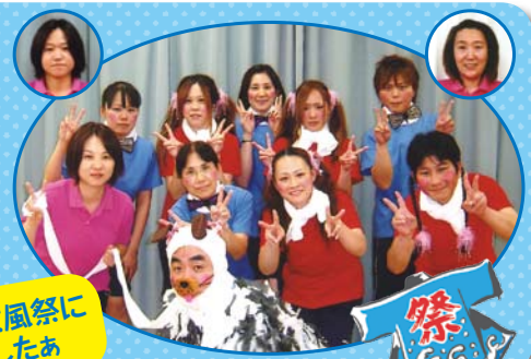
スタッフも涼風祭に 参加しましたあ