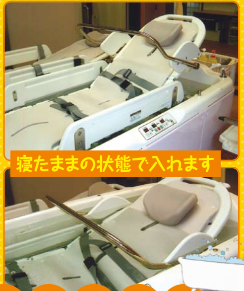
寝たままの状態でも入れます