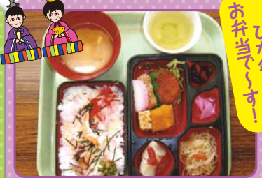
お弁当 ひな祭り です！