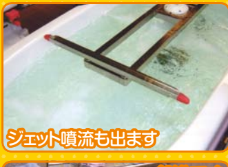
ジェット噴流も出ます

寝たままの状態に入れる特浴が新しくなりました。 ジェット噴流も4カ所から出ます。 ご家庭でも入浴困難な方はもちろん、見学だけでも 大歓迎です。スタッフ一同お待ちしております。