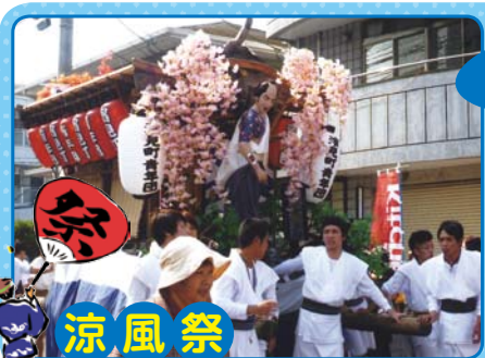
祭りだ ワッショイ！