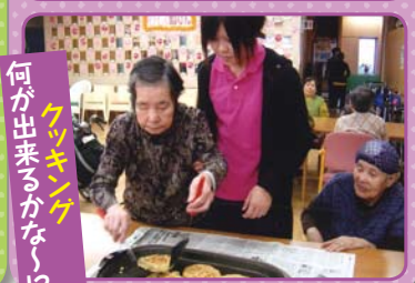
何が出来 るかな？！ クイズ