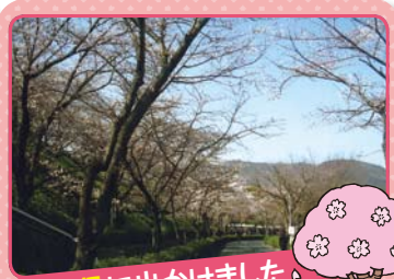
花見に出かけました。